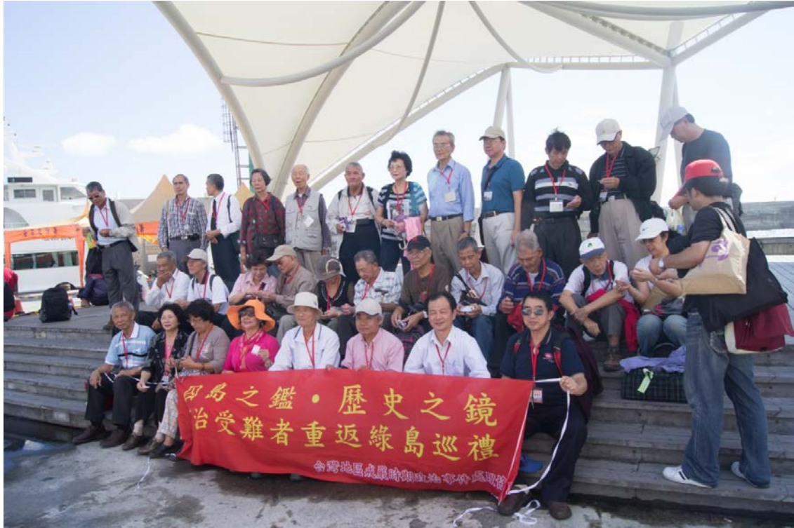
第三梯次重返綠島團員攝於台東富岡漁港碼頭