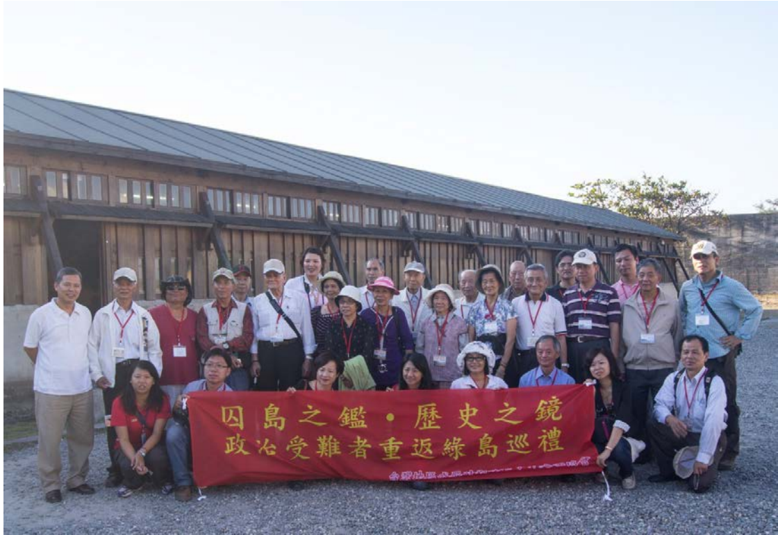
第一梯次重返綠島團員參觀第三大隊展示區展示區合影