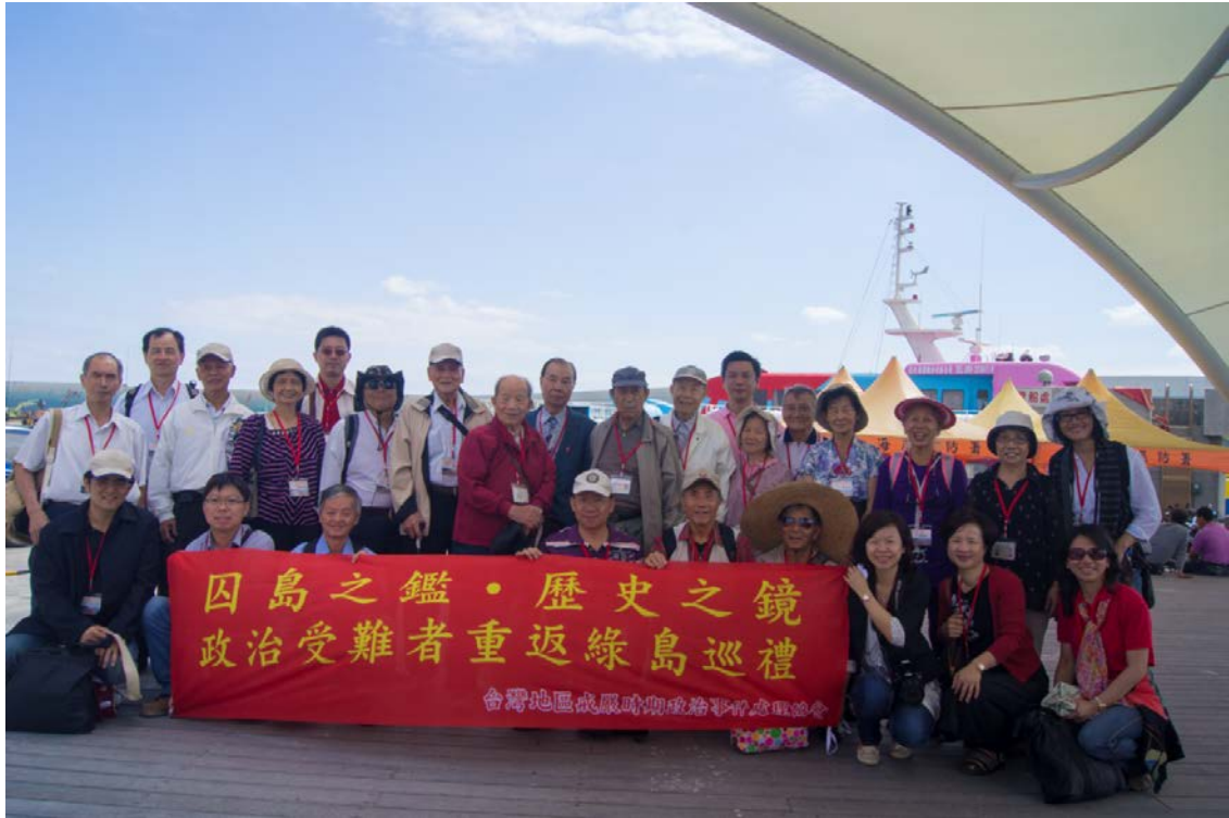
第一梯次重返綠島團員攝於台東富岡漁港碼頭