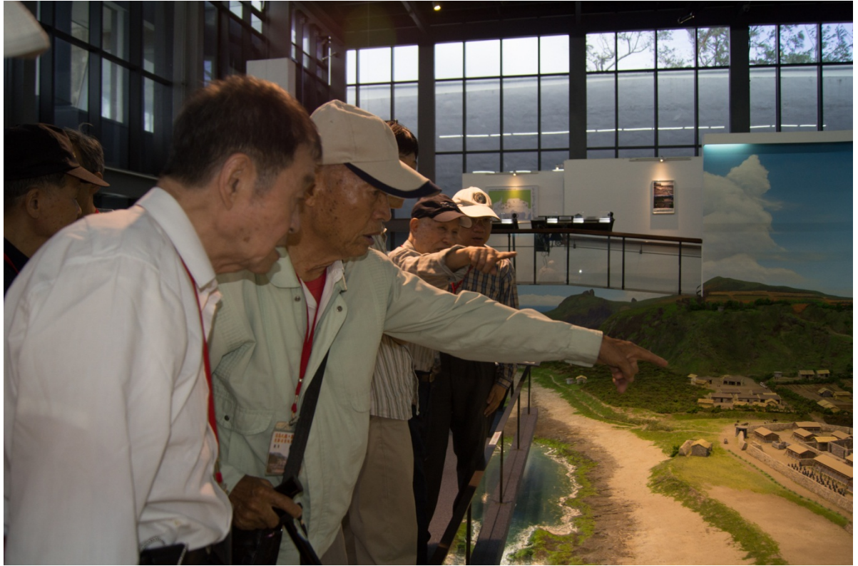
第二梯次重返綠島團員參觀新生訓導處時期全區多媒體展示區