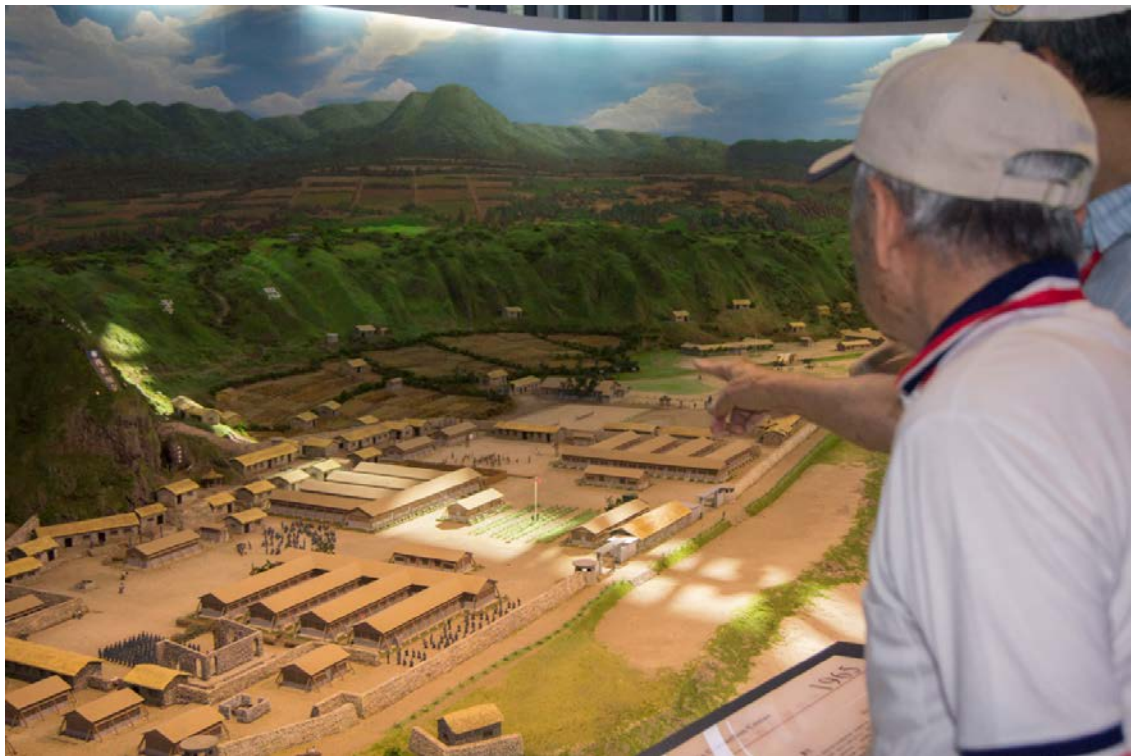
第一梯次重返綠島團員參觀新生訓導處時期全區多媒體展示區