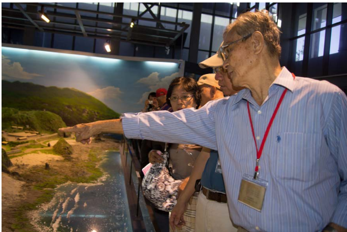
第三梯次重返綠島團員參觀新生訓導處時期全區多媒體展示區