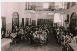
孤兒院大廳 作為餐廳用

柯札克相信「改變世界就要改革教育」，他的觀念與精神被視為當代兒童教育的先鋒，也影響「兒童權利公約」的核心價值。