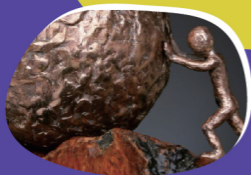
國際兒童和平獎的獎座是以 一個孩子推動地球為造型設計

國際兒童和平獎是荷蘭兒童權利基金會於2005年為兒童設立的獎項。每年頒獎給一位傑出的兒童，表彰他們以英勇的行動落實了兒童參與權，並幫助了其他兒童。該獎項的設立，是為兒童提供一個表達想法及推動兒童權利的平臺。這些兒童獲獎後，仍然持續為他們所關注的議題發聲與行動。