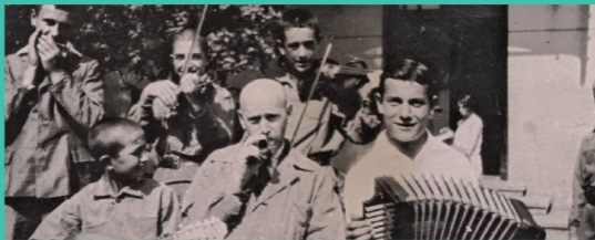
柯札克與孤兒院兒童們

除此之外，波蘭於2000年設立波蘭兒童人權監察使，這是一個獨立的兒童權利機構，負責保護促進兒童和青少年的權利，且具有像檢察官一樣權利，可以提出告訴，要求公權力機關提出報告，對負責兒童政策的權利機關提出警訊。