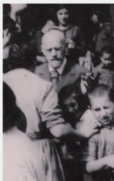
雅努什·柯札克, Janusz Korczak

在波蘭華沙出生。他是一位猶太裔的醫生、作家，更是一位富有創造力的教育家。他從小就希望為兒童創造一個美好世界，成年之後以畢生精力為兒童權利付出，因此被譽為「兒童權利之父」。