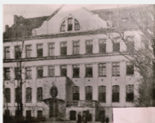
1920年華沙 孤兒之家外觀