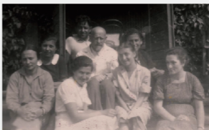
1933年柯札克與夏令營的工作人員